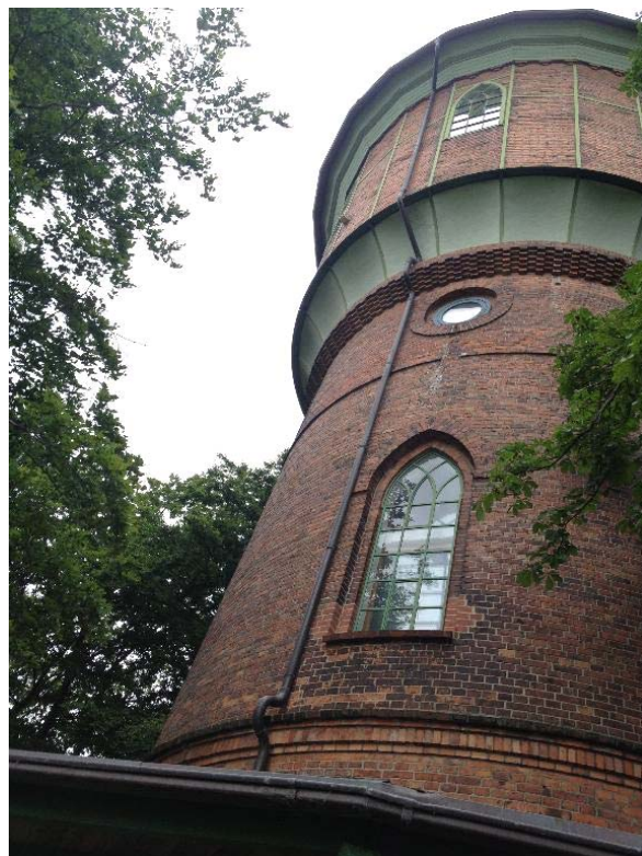
Blick in die Höhe