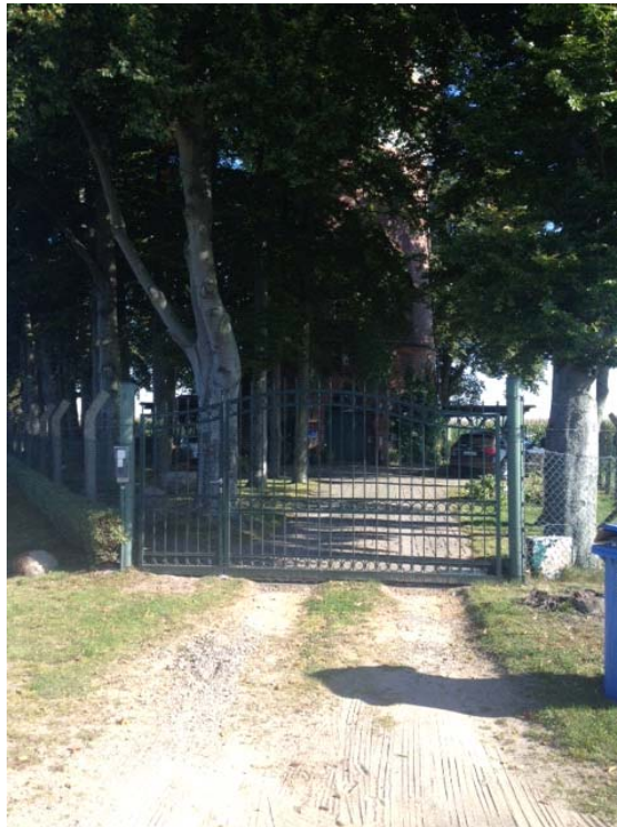
Einfahrt zum Grundstück